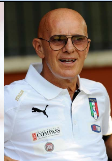
A sx il presidente del Club Italia Demetrio Albertini; a dx il Coordinatore delle Nazionali Giovanili Arrigo Sacchi