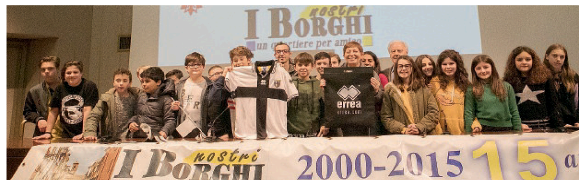
«NATALE IN VETRINA CROCIATA» Qui sopra, la media Pelacani di Noceto che ha vinto il premio «Ecologia e Riciclo». In alto da sinistra, la 4ªB della Don Milani che ha vinto il primo premio della giuria popolare e i bimbi della Micheli che hanno vinto il primo premio della giuria artistica.

Affiancando, ai simboli della tradizione natalizia, come gli alberi e le luci, gli elfi, le renne ed i folletti, gli altri capaci di testimoniare la fede calcistica